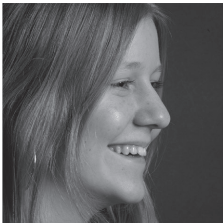
Stand Juli 2008layout: imdialog.net

Liberales Frauen Baden-Württemberg Jutta Pagel-Steidl Eschenweg 30 72582 Grabenstetten Tel. 07382 / 938 770 Fax 07382 / 941 145 Email Jutta.Pagel@t-online.de